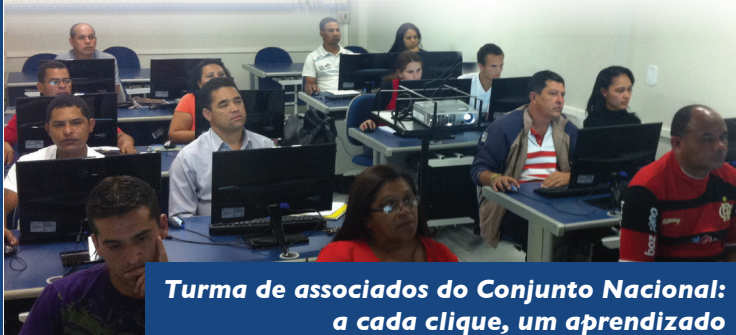
Turma de associados do Conjunto Nacional: a cada clique, um aprendizado

O Seicon-DF contratou a Escola de Informática de Brasília DF (Eibnet) para oferecer curso de informática aos colaboradores associados do Condomínio do Conjunto Nacional Lojista e Salista. A turma de 47 alunos, totalmente custeada pelo sindicato, começou as atividades em 6 de agosto e está aprendendo sobre ambiente operacional, edição de textos, planilhas de cálculo, apresentação de slides e navegação na Internet. Se você quiser fazer parte da próxima turma, é só entrar em contato com o sindicato para mais informações.